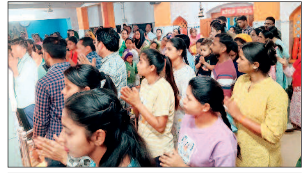
रेशन उपाध्यय ने बताया कि धार्मिक मान्यता के अनुसार महाशिवरात्रि के बाद भगवान शिव माता पार्वती का गौना कराकर पहली बार काशी पहुंचे थे। उनके आगमन की खुशी में शिवगणों, संतों, भक्तों और वंचित समाज द्वारा फूलों के रंग और चिता की राख से स्वागत किया गया था। इसी परंपरा को आगे बढ़ाते हुए यह पर्व रंगभरी एकादशी के रूप में मनाया जाने लगा, जो मुख्य होली से चार दिन पूर्व आता है।