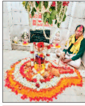
बछिया के गोबर से बनी भस्म से हुआ भोलेनाथ का अभिषेक