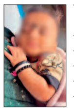
बच्चा छोड़ने की यह दूसरी घटना

मां छह माह की मासूम बच्ची को रूद्री थाना में छोड़कर चली गई है। पुलिसकर्मीयों ने बच्ची को सुरक्षित रख इसकी सूचना चाइल्डलाइन को दी। टीम मौके पर पहुंची और बच्ची को अपने अधीन में ले लिया। फिलहाल दोनों बच्चों को कांकेर की दत्तक ग्रहण एजेंसी में सुरक्षित रखा गया है। एक माह की दवा आपत्ति की अवधि दी गई है। यदि इस दौरान परिजन सामने नहीं आते तो विधिक प्रक्रिया के तहत बच्चों को स्वतंत्र घोषित कर उनके बेहतर भविष्य व परवरिश की दिशा में आगे की कार्रवाई की जाएगी। शहर में हो रही इस तरह बच्चा छोड़ने की घटना कई संवाल खड़े कर रही है।