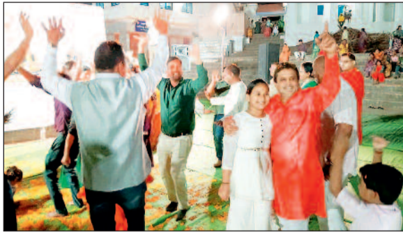
शिवमविति और परंपरा का अद्भुत संगम